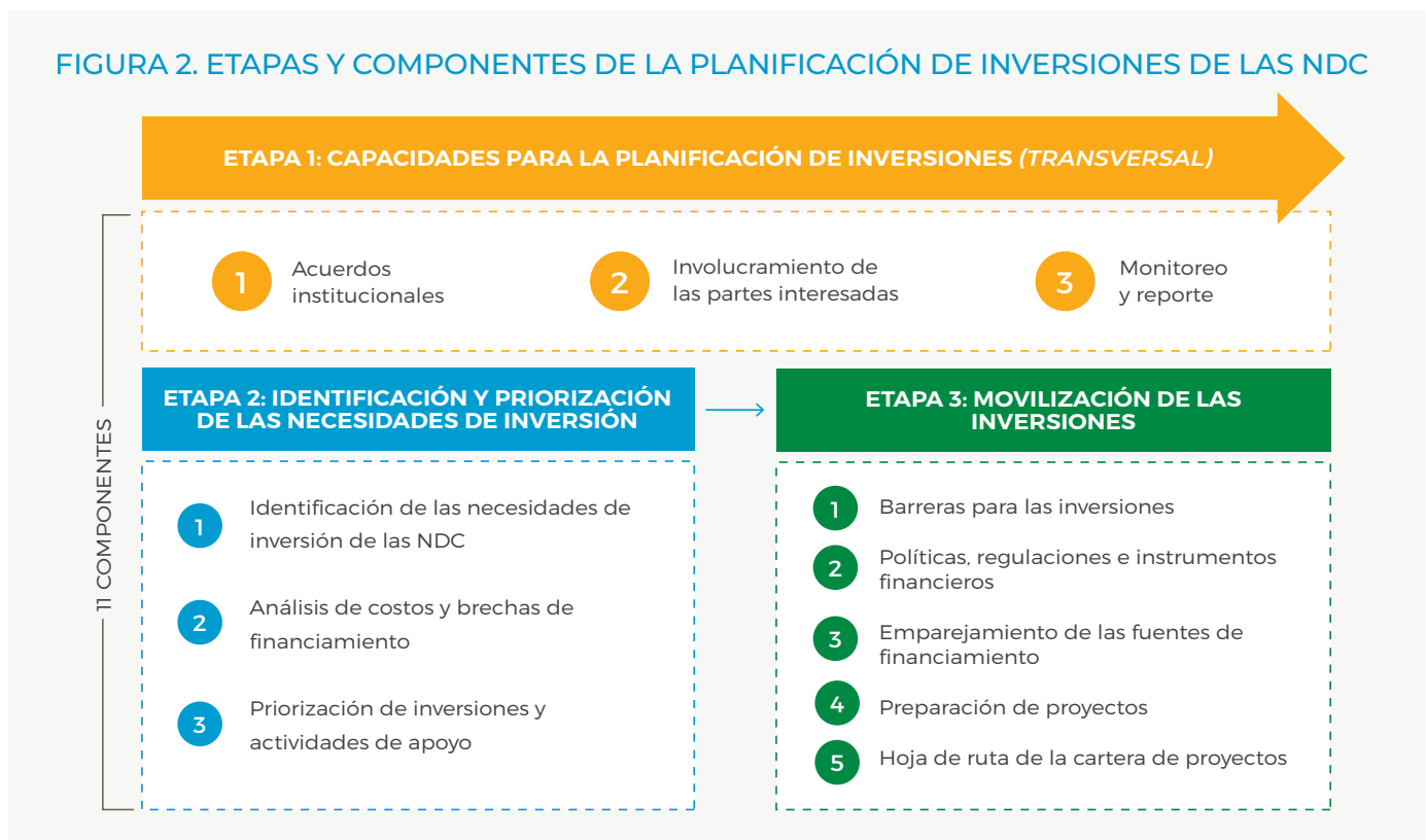
FIGURA 2. ETAPAS Y COMPONENTES DE LA PLANIFICACIÓN DE INVERSIONES DE LAS NDC

Mediante una secuencia ilustrativa y un abanico de productos que pueden utilizarse para avanzar en la planificación de inversiones de las NDC, la Guía pretende ayudar a los gobiernos y a otras partes interesadas a transitar estos complejos procesos, desde la identificación de las necesidades hasta la movilización de los recursos. En síntesis, la Guía puede ser muy útil para los siguientes cuatro grupos de partes interesadas: (1) los países miembros de NDC Partnership (p. ej., los ministerios de finanzas y medio ambiente y otras entidades ejecutoras de proyectos), (2) los socios financieros e implementadores (p. ej., los bancos multilaterales de desarrollo, los fondos climáticos y otros instrumentos multilaterales/bilaterales de financiamiento), (3) el sector privado (p. ej., fondos de inversión y gestores de activos, y filantropías interesadas en cómo los países originan, priorizan y promueven proyectos de inversión alineados con las NDC) y (4) organizaciones de la sociedad civil (p. ej., grupos u organizaciones que desempeñan un papel en la construcción de resiliencia comunitaria y que defienden intereses sociales específicos y objetivos climáticos a nivel nacional).