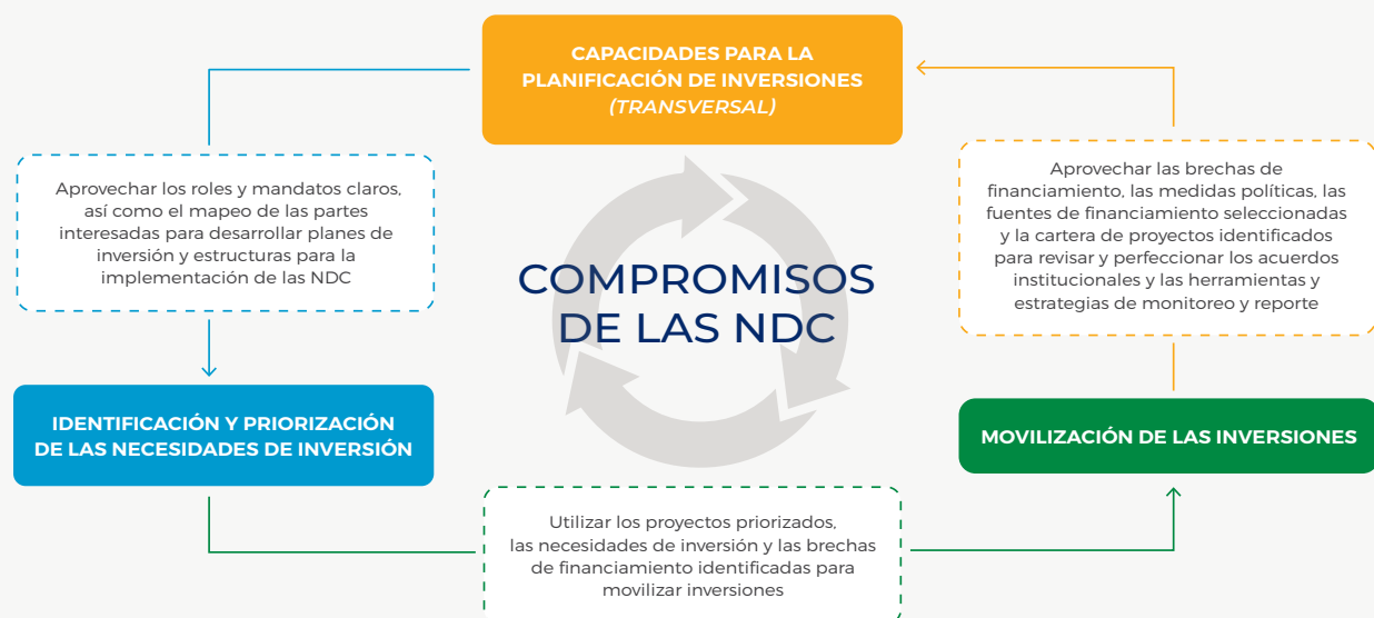
FIGURA 1. TRANSFORMACIÓN DE LOS COMPROMISOS DE LAS NDC EN ACCIONES

Estas orientaciones no pretenden ser utilizadas como una plantilla o un manual. Por el contrario, su uso se debe ajustar a las circunstancias propias de cada país. En ese sentido, la Guía responde a tres principios rectores: